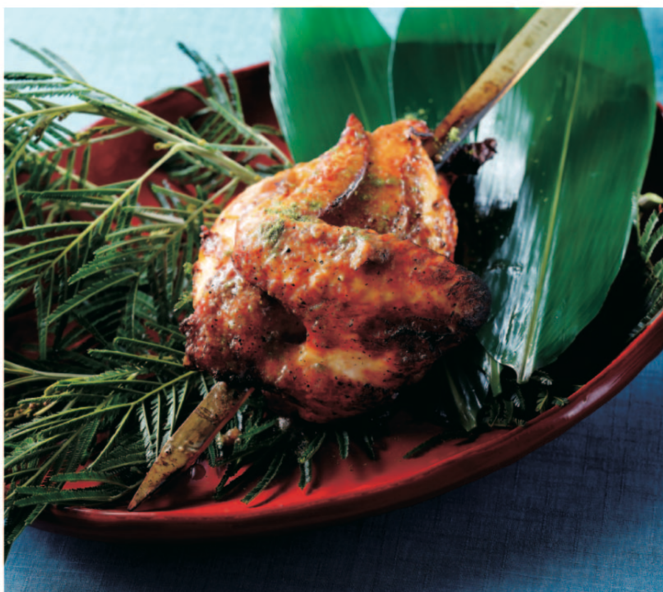
名物「淡路鶏 山賊焼き」山椒醤油

Aman Special! Bandit-Style Grilled Awaji Island Chicken with Japanese Pepper Soy Sauce