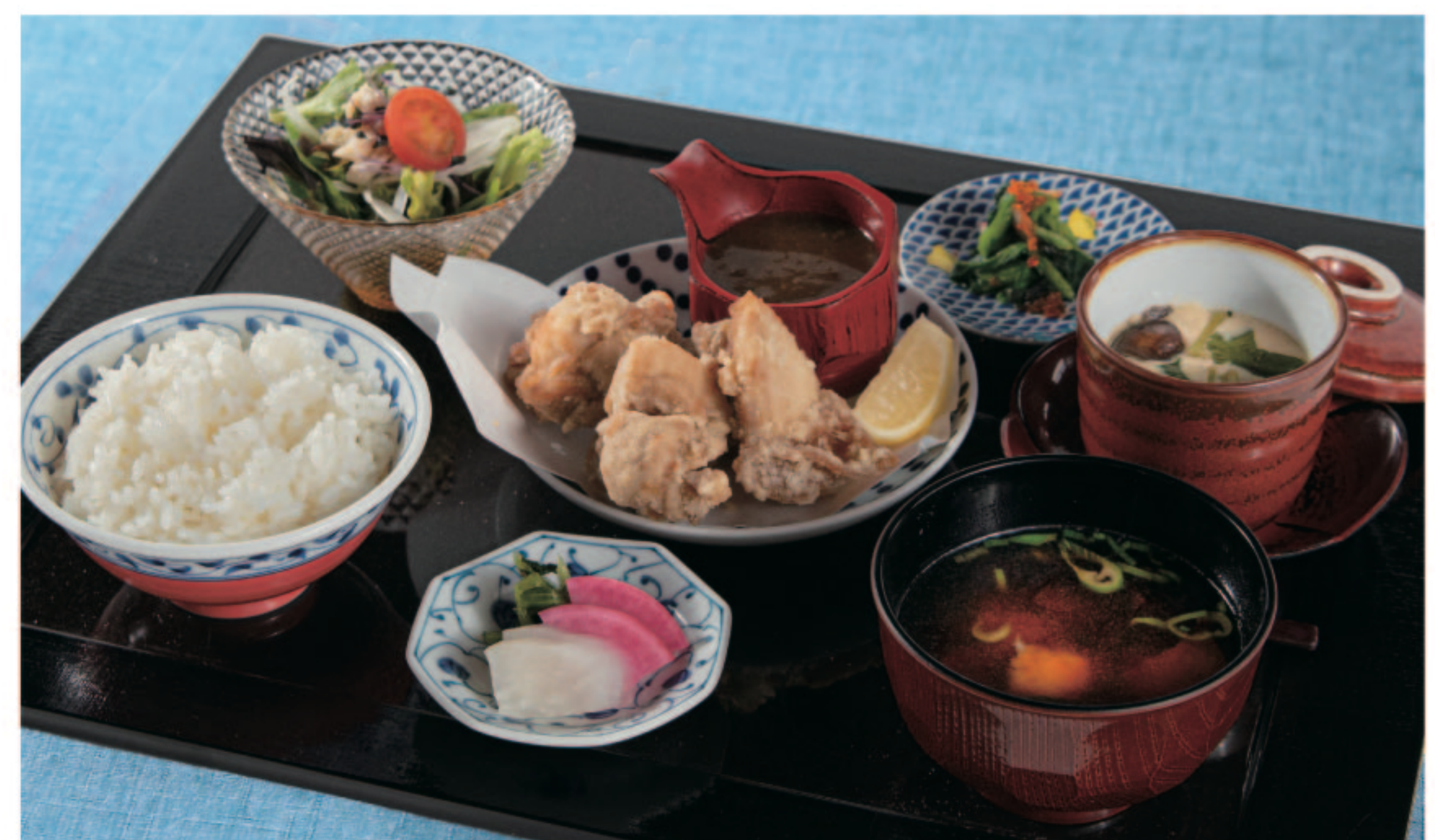
海神人の鶏竜田揚げ Aman's Tatsuta-Age Fried Chicken

※写真はイメージです。詳細はスタッフにお尋ねください。The pictures of the menu are for illustration purposes only. Please feel free to ask our staff for further details.