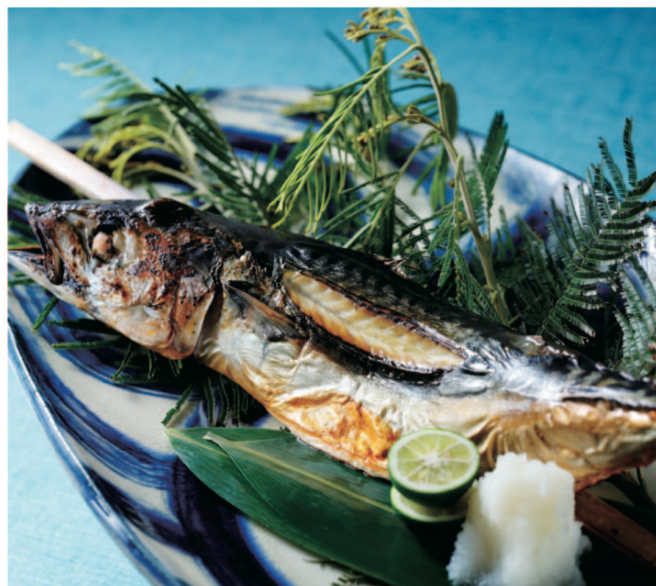
名物 淡路旨味丸サバ海賊焼き

Aman Special! Bandit-Style Grilled Awaji Island Chicken with Japanese Pepper Soy Sauce