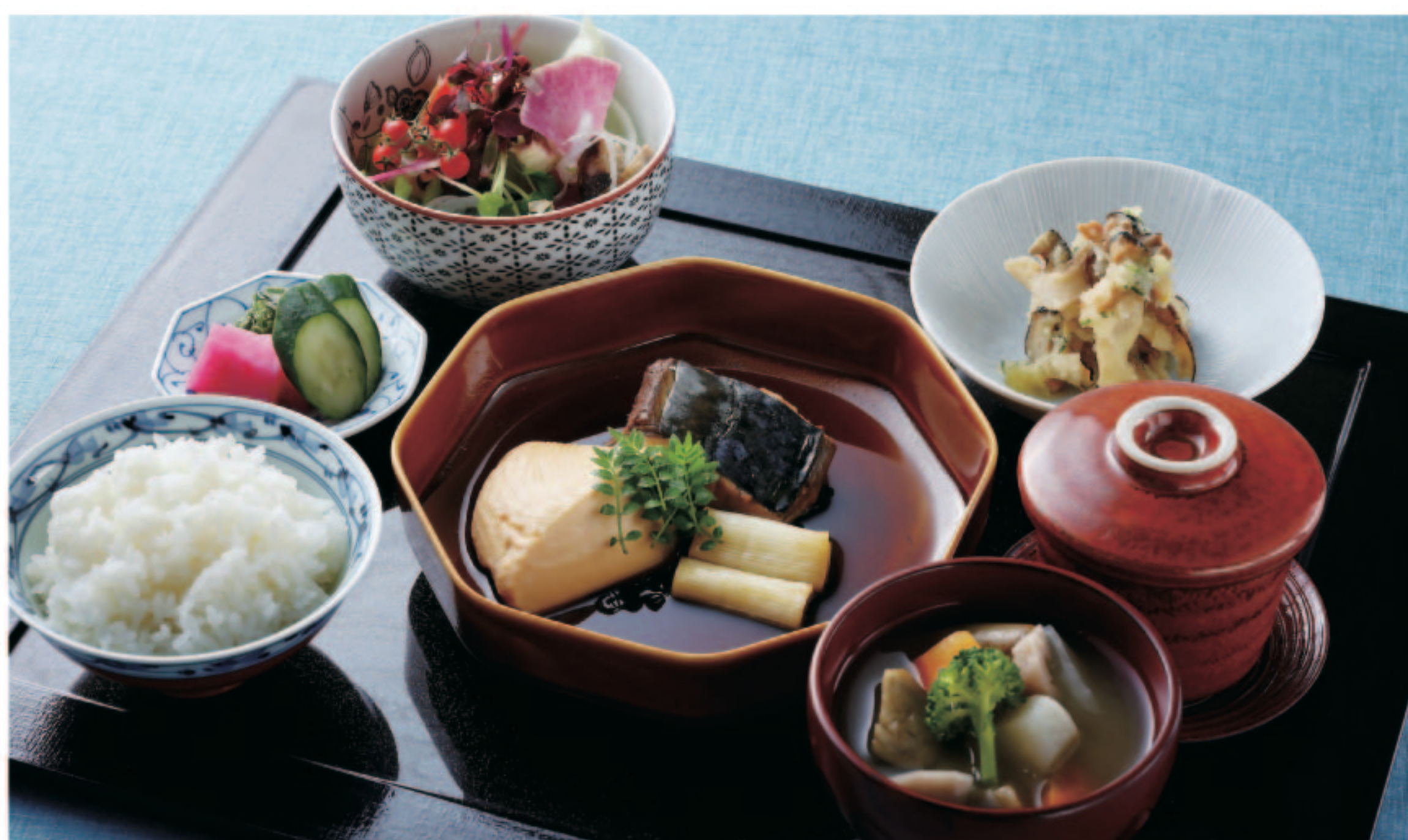
本日の煮魚 Fish Stew of the Day