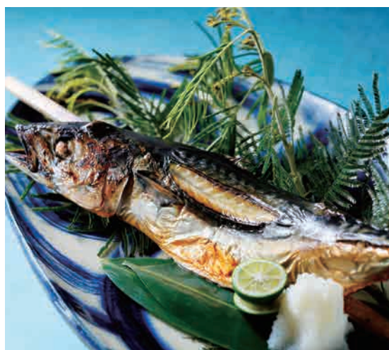
名物 淡路旨味丸サバ海賊焼き