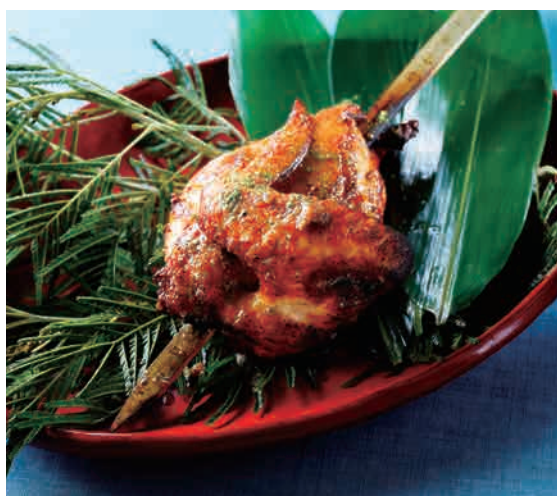
名物「淡路鶏 山賊焼き」黒胡椒香り醤油